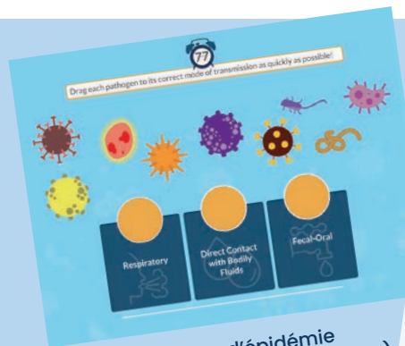
WASH en situation d'épidémie (anglais, français, espagnol, arabe)

L'Espace de formation READY contient plus de 60 cours sur la préparation et la réponse aux épidémies, lesquels sont soigneusement sélectionnés par des acteurs clés tels que l'OMS, l'UNICEF et d'autres organisations. Recherchez par maladie ou par sujet.